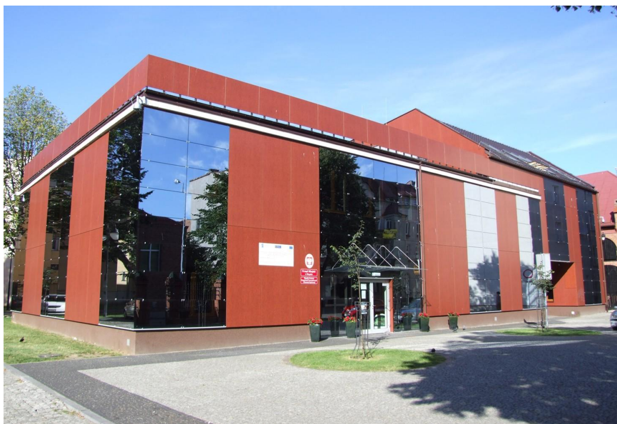
Fot. Słupskie Centrum Organizacji Pozarządowych i Ekonomii Społecznej, 2014 r.