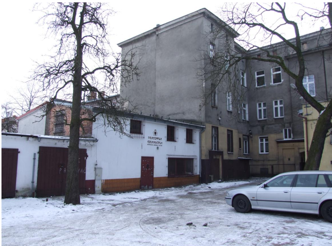
Fot. Pracownia Ceramiczna, stan sprzed przebudowy