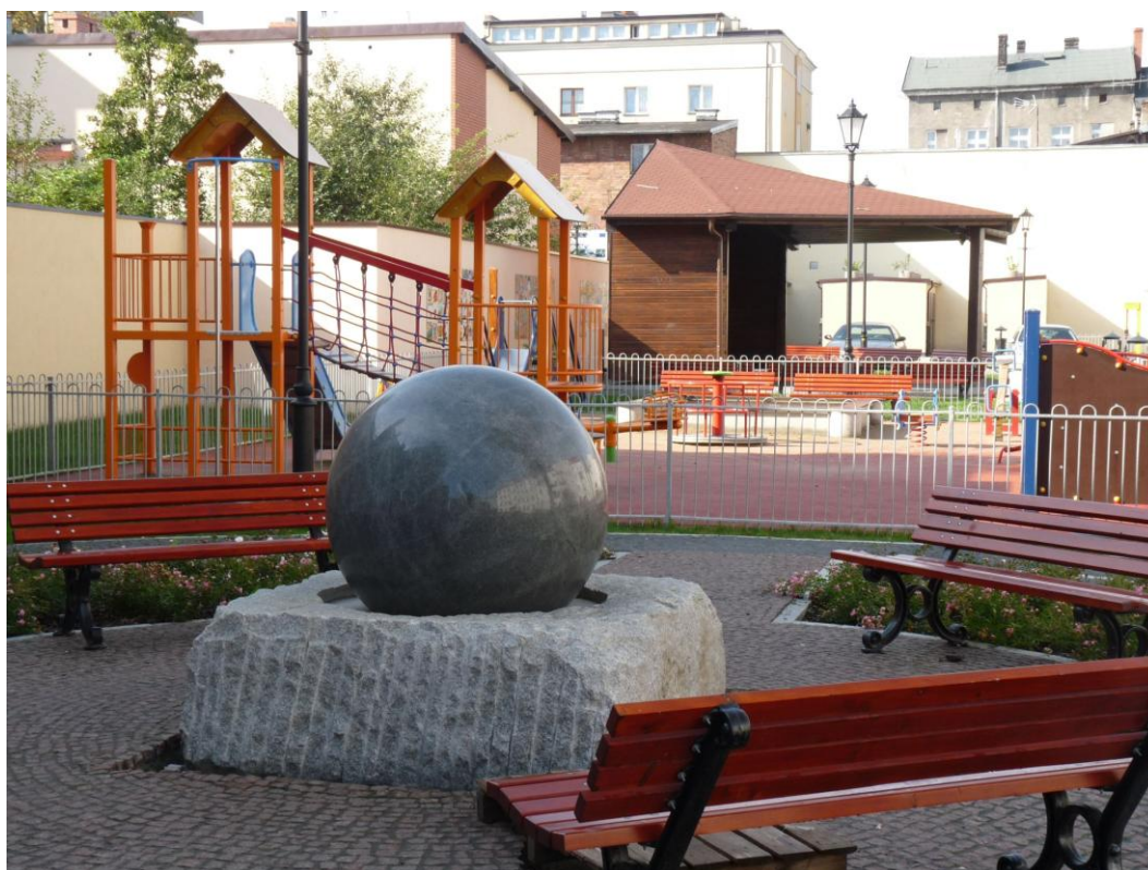
Fot. Teren tzw. Podwórka Kulturalnego, stan po przebudowie, 2012 r.