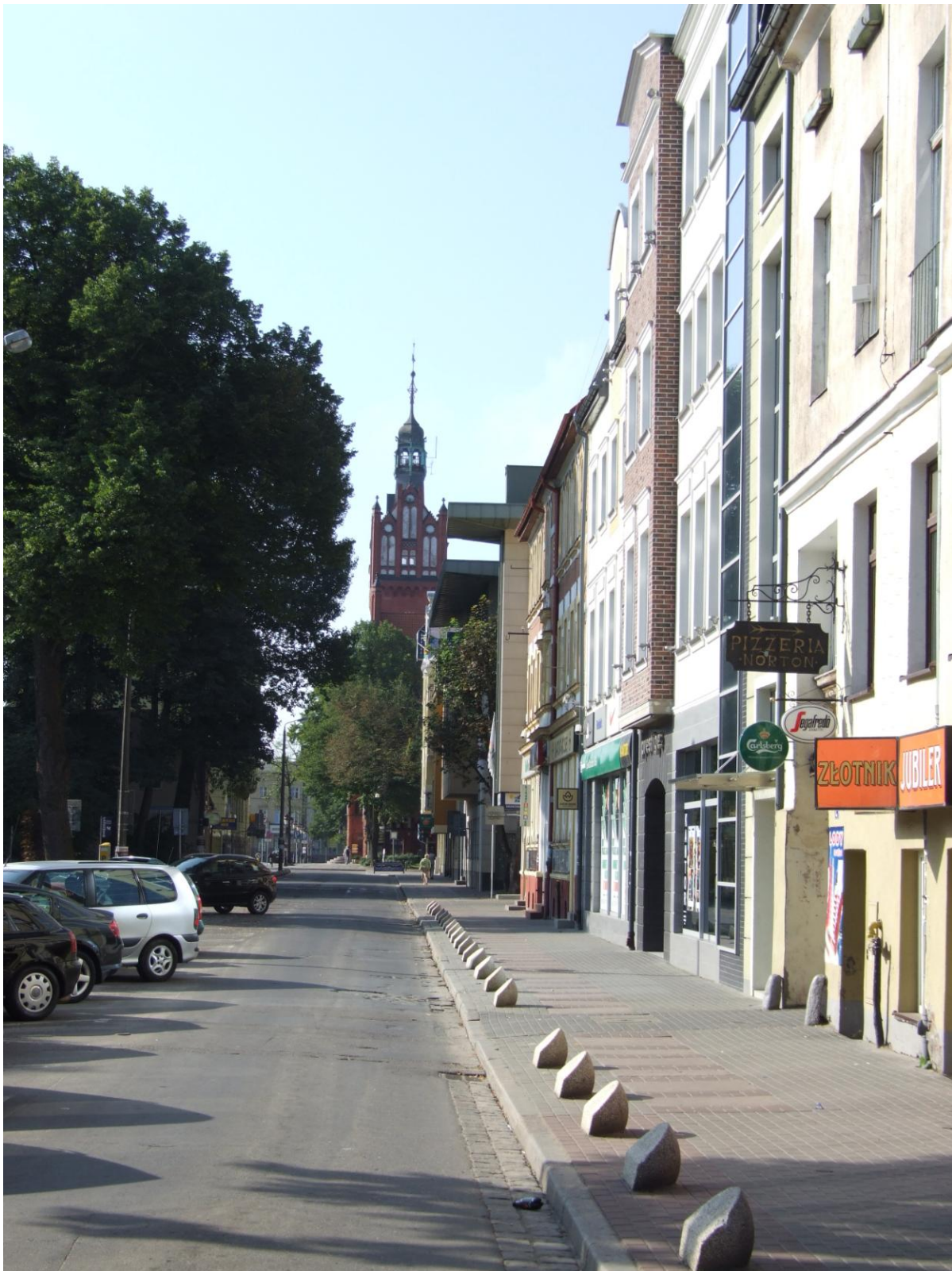
Fot. Ulica S. Starzyńskiego, stan sprzed przebudowy