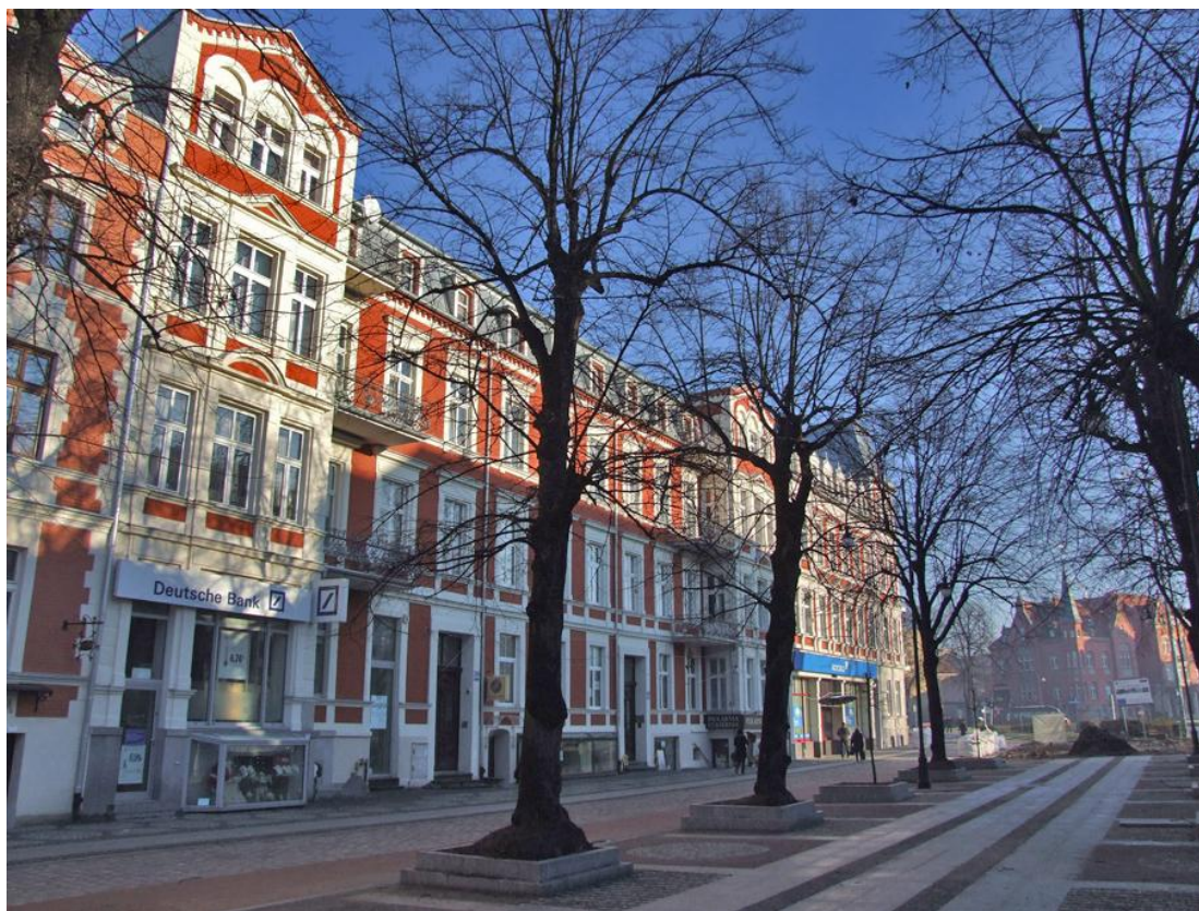
Fot. Wyremontowane kamienice przy ulicy Wojska Polskiego, XII 2011 r.