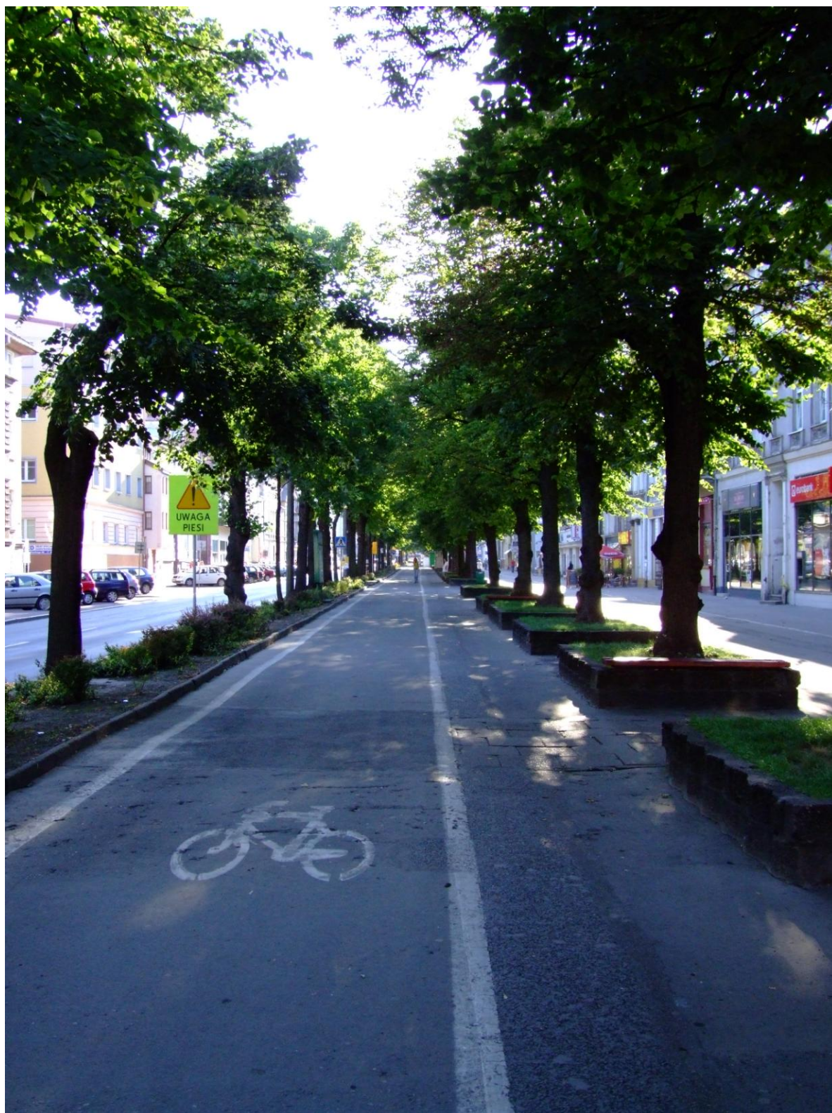
Fot. Ulica Wojska Polskiego, stan sprzed przebudowy