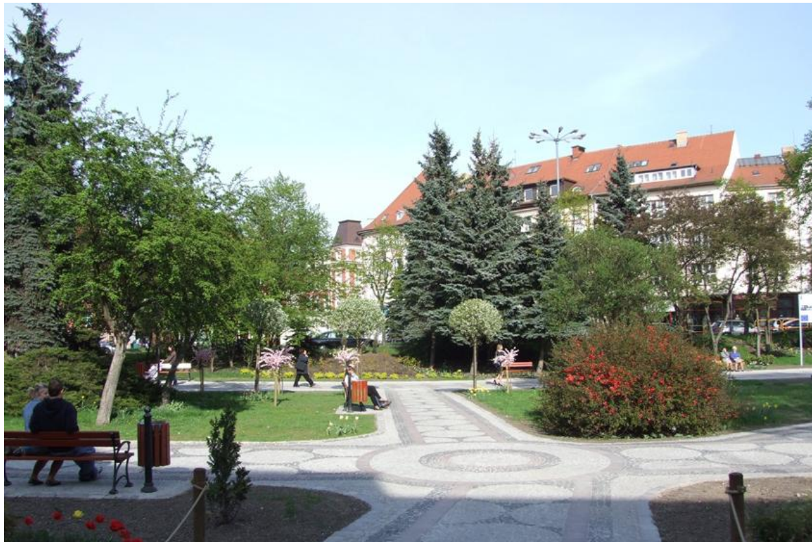
Fot. Skwer Pierwszych Słupszczyzan, stan po przebudowie, 2012 r.