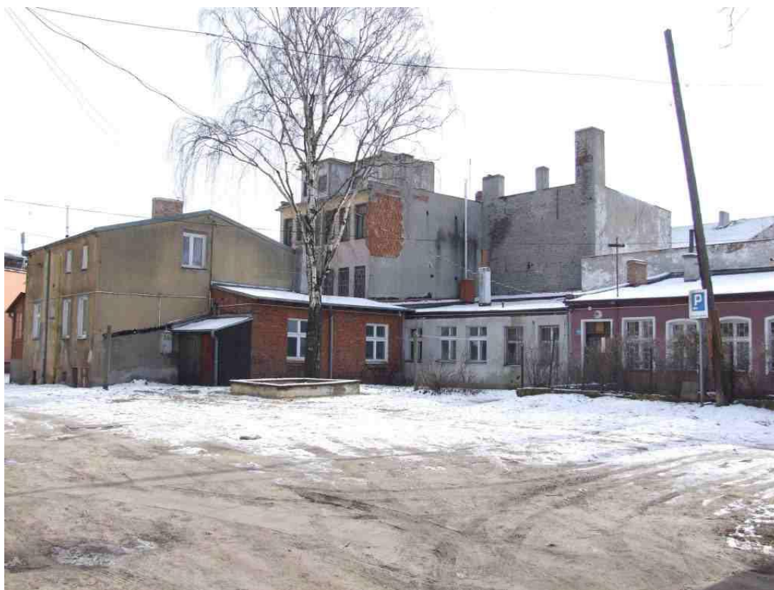
Fot. Teren tzw. Podwórka Kulturalnego, stan sprzed przebudowy, 2010 r.