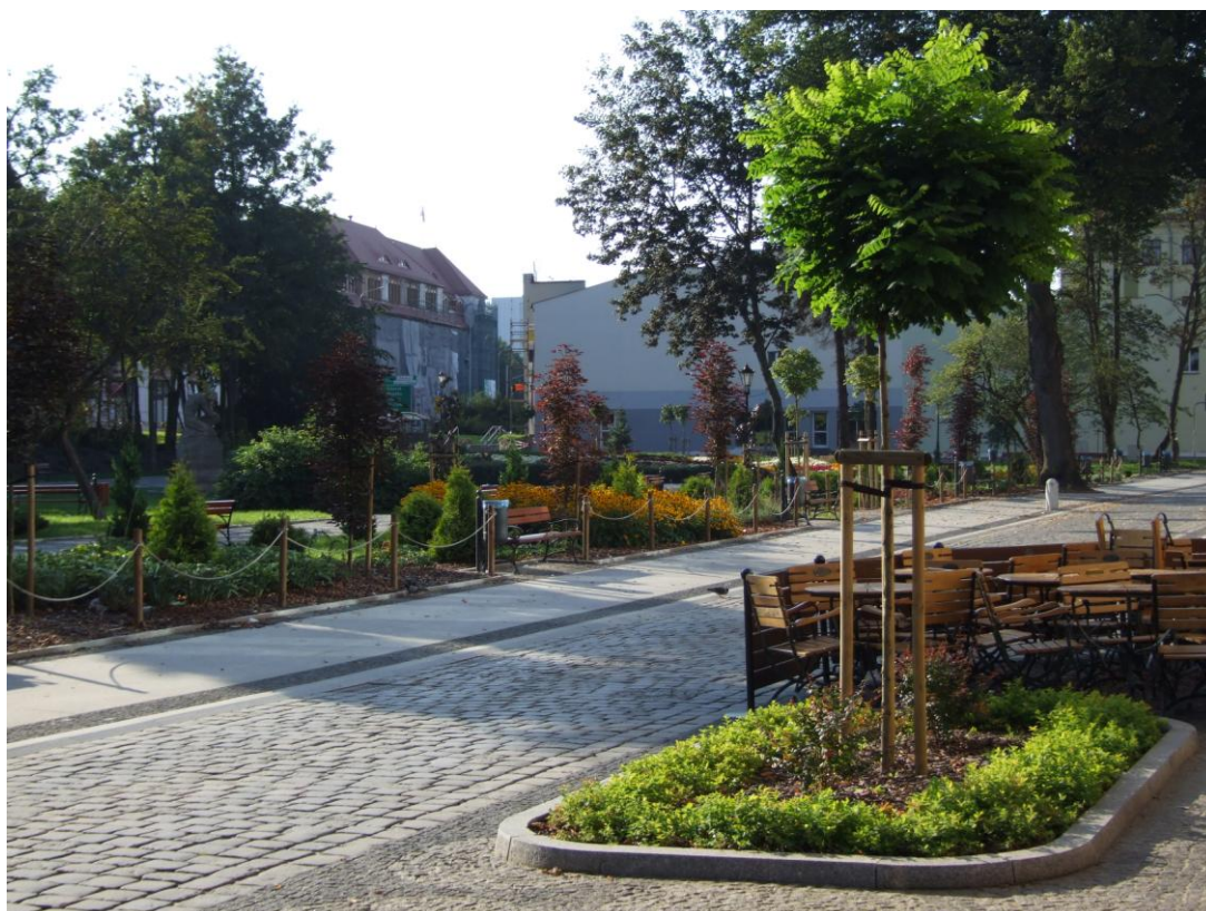
Fot. Ulica S. Starzyńskiego wraz ze Skwerem Pierwszych Słupszczan, stan po przebudowie, 2012r