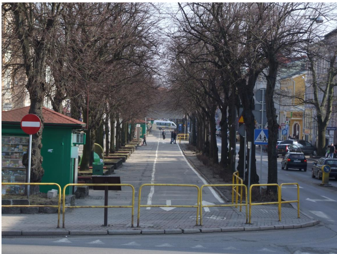
Fot. Ulica Wojska Polskiego, stan sprzed przebudowy