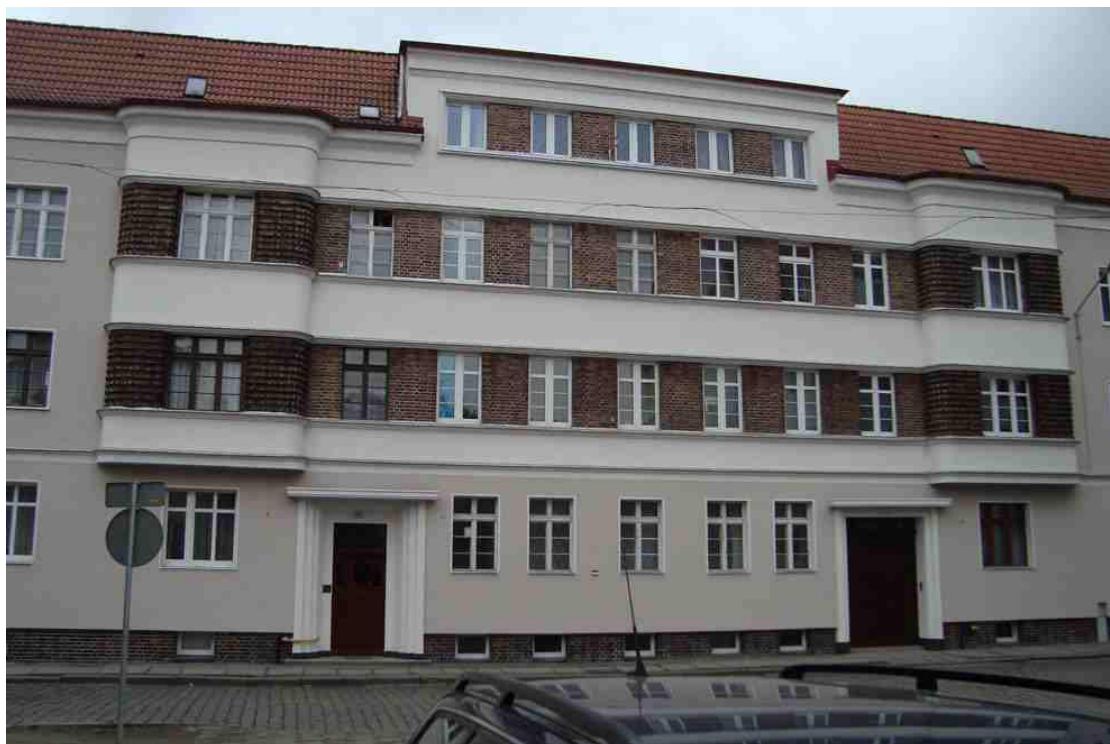
Fot. Wyremontowana kamienica przy ulicy Krasieńskiego, 2013 r.