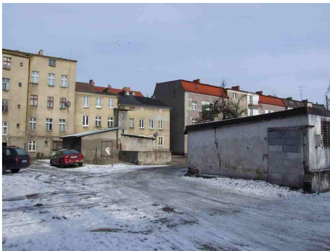
Fot. Teren tzw. Podwórka Kulturalnego, stan sprzed przebudowy, 2010 r.