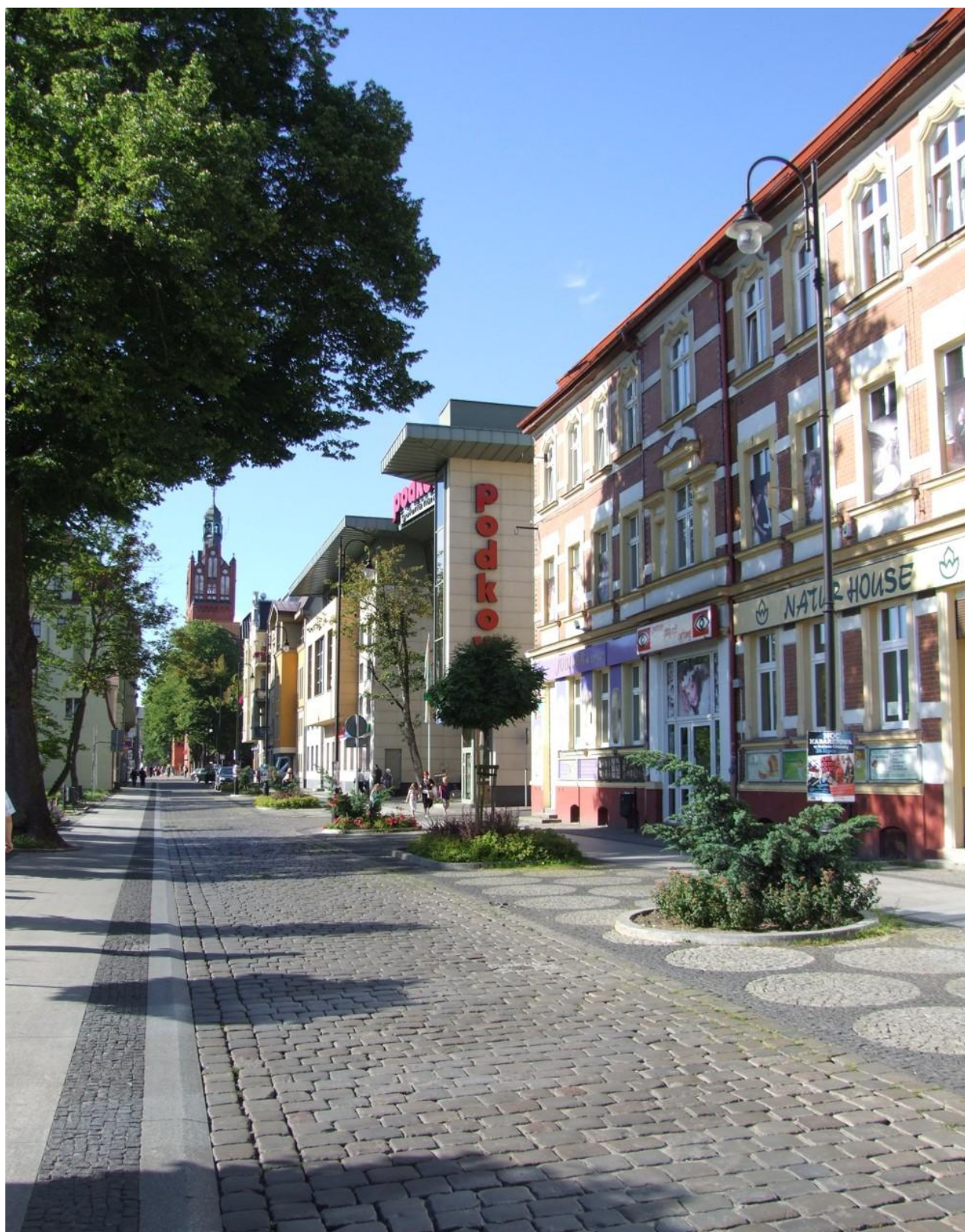
Fot. Ulica S. Starzyńskiego, stan po przebudowie, 2014 r.