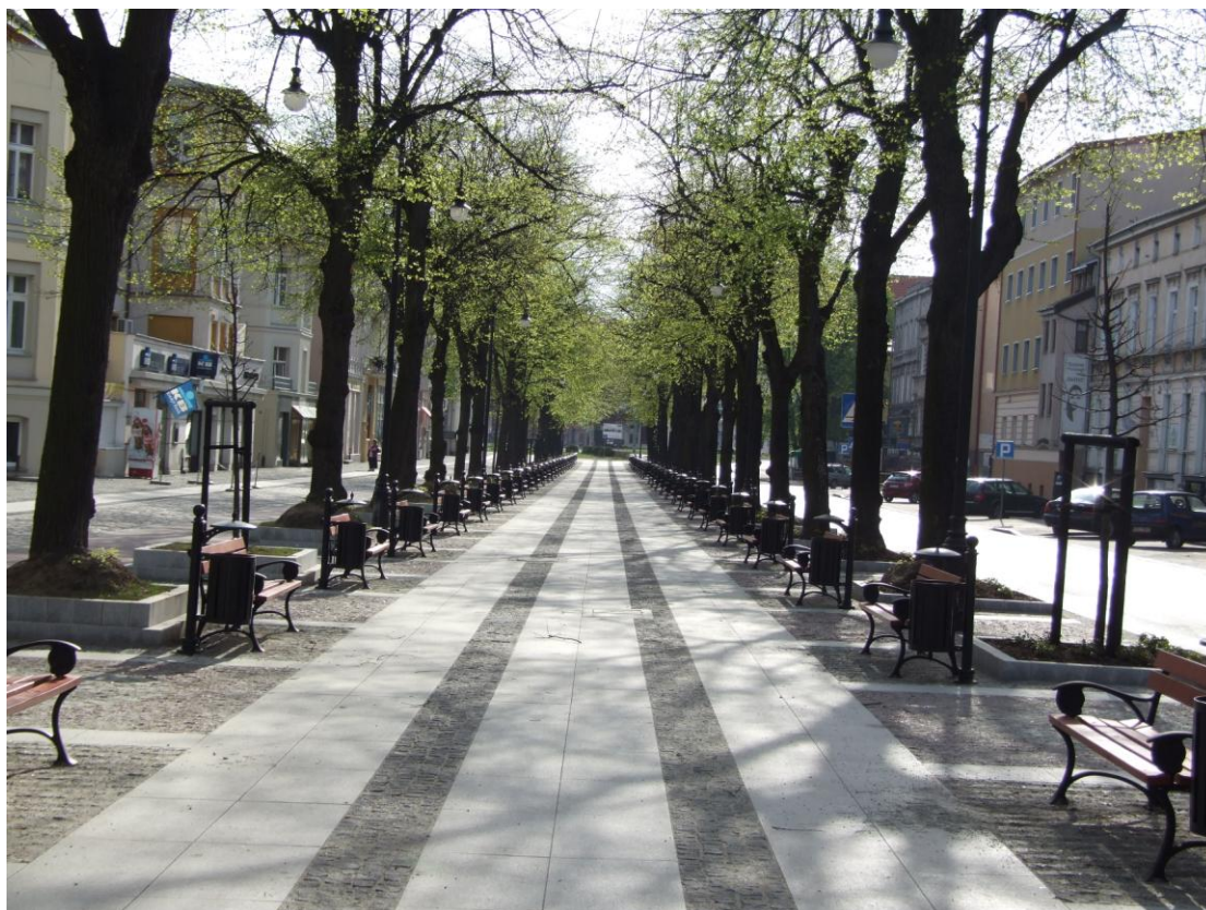
Fot. Ulica Wojska Polskiego, stan po przebudowie