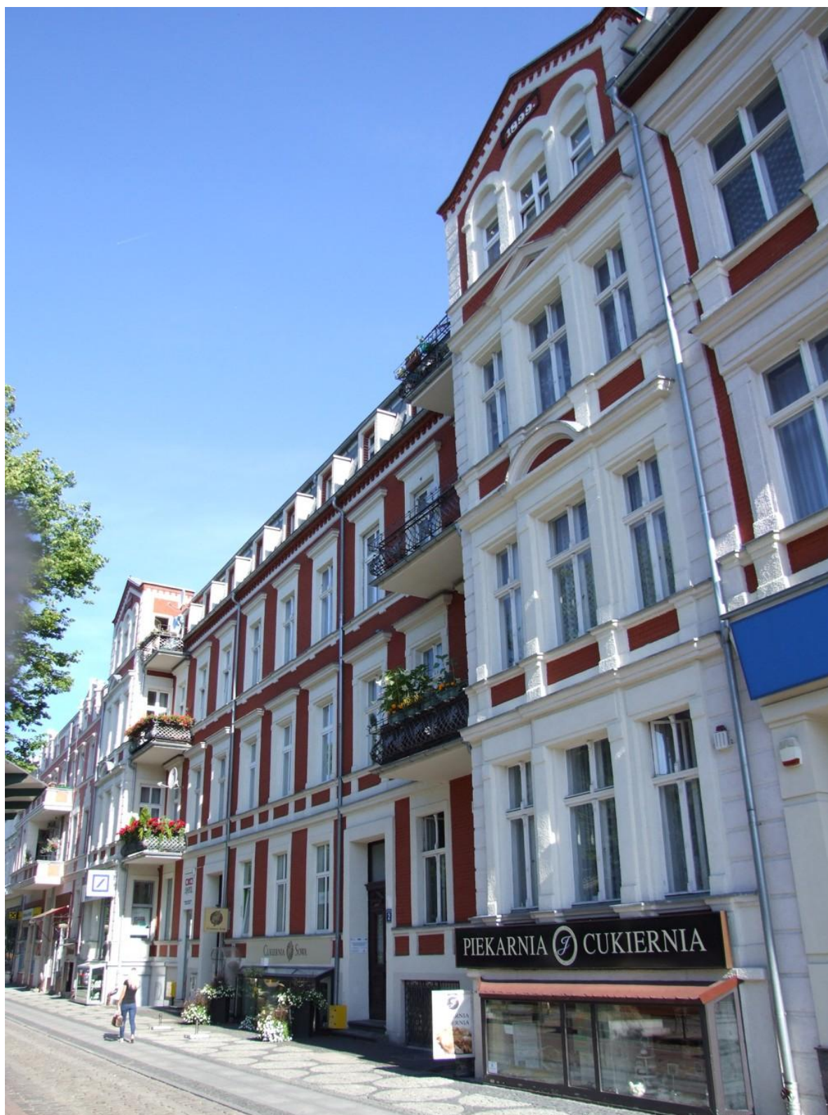
Fot. Ulica Wojska Polskiego, stan po przebudowie, 2014 r.