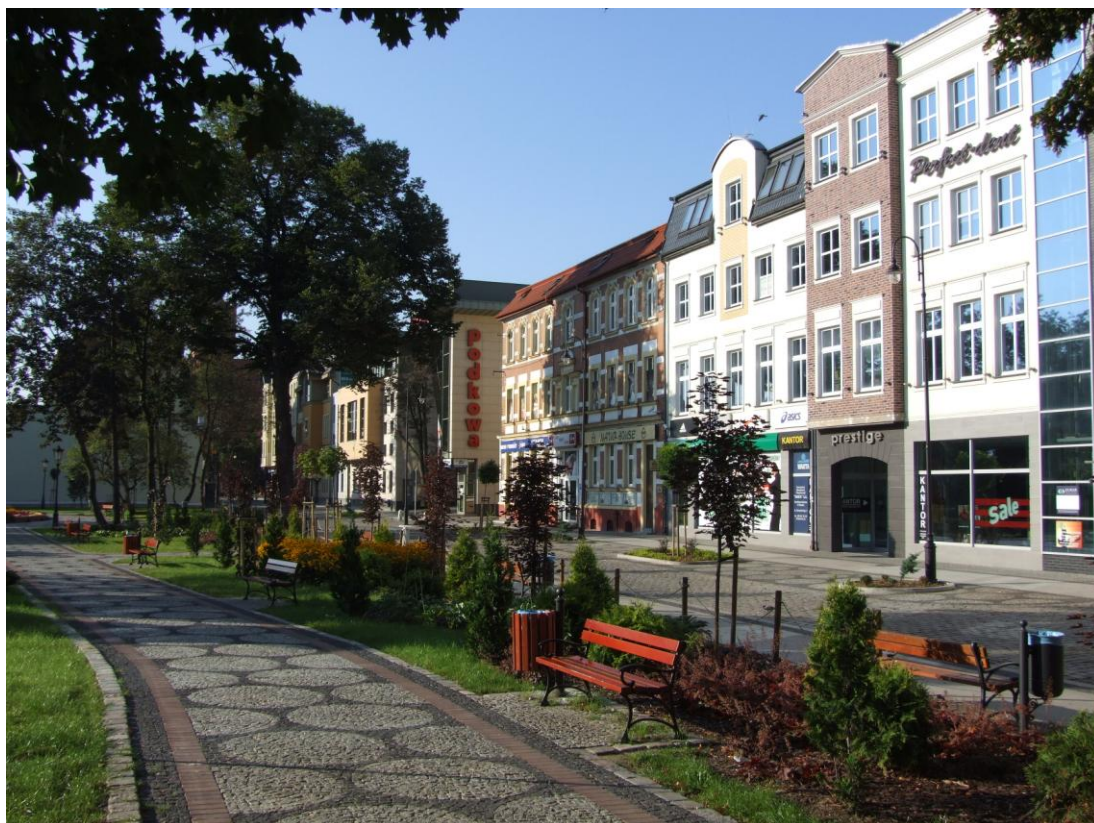
Fot. Ulica S. Starzyńskiego, stan po przebudowie, 2012 r.