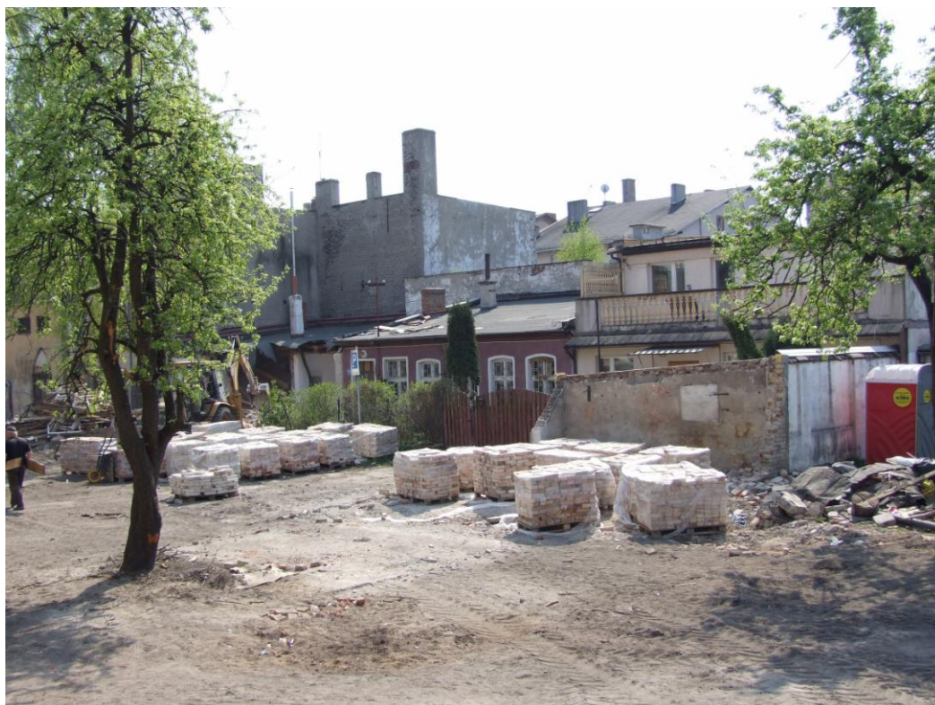
Fot. Teren tzw. Podwórka Kulturalnego, w trakcie przebudowy, 2011 r.