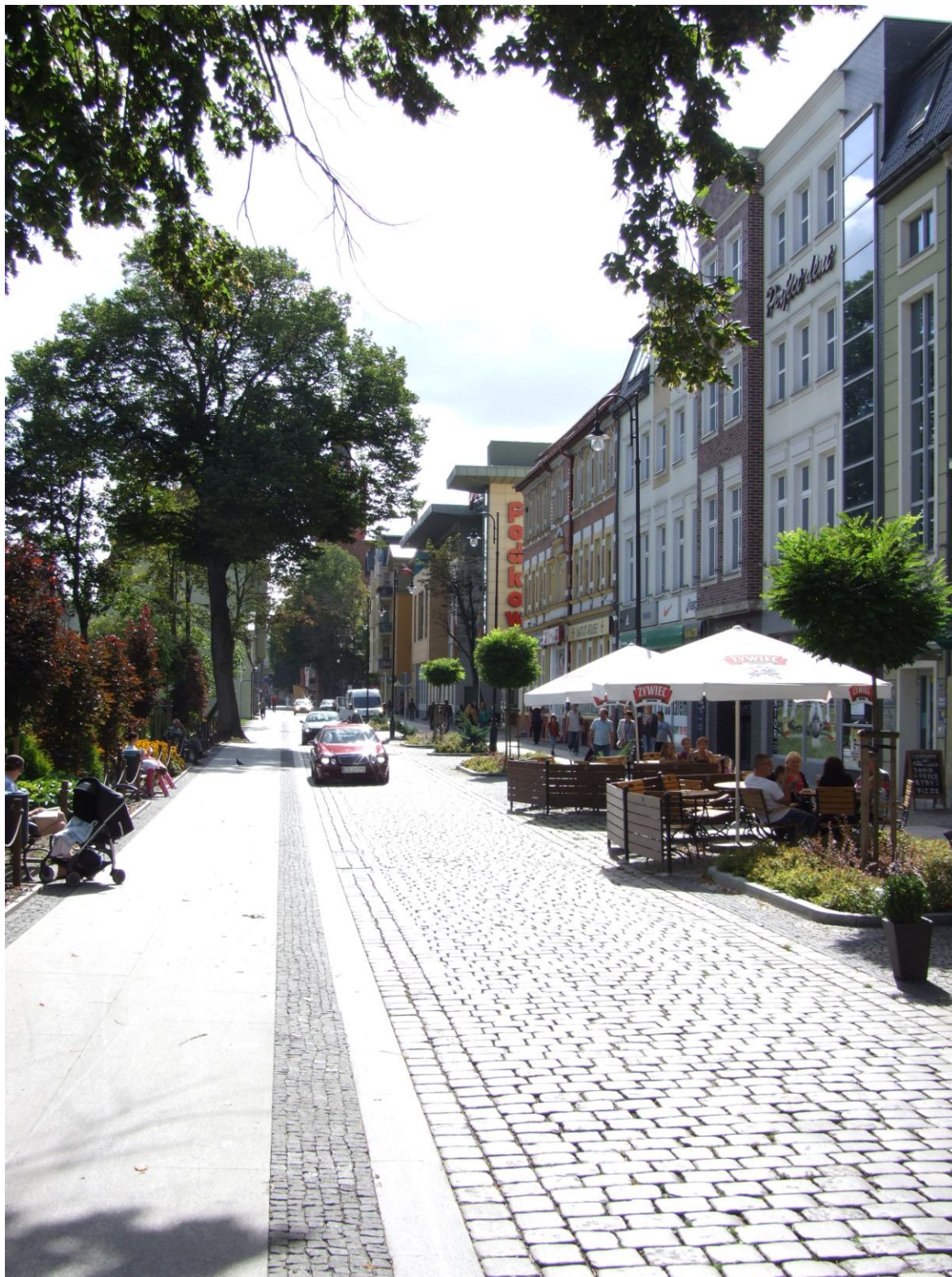
Fot. Ulica S. Starzyńskiego, stan po przebudowie, 2012 r.