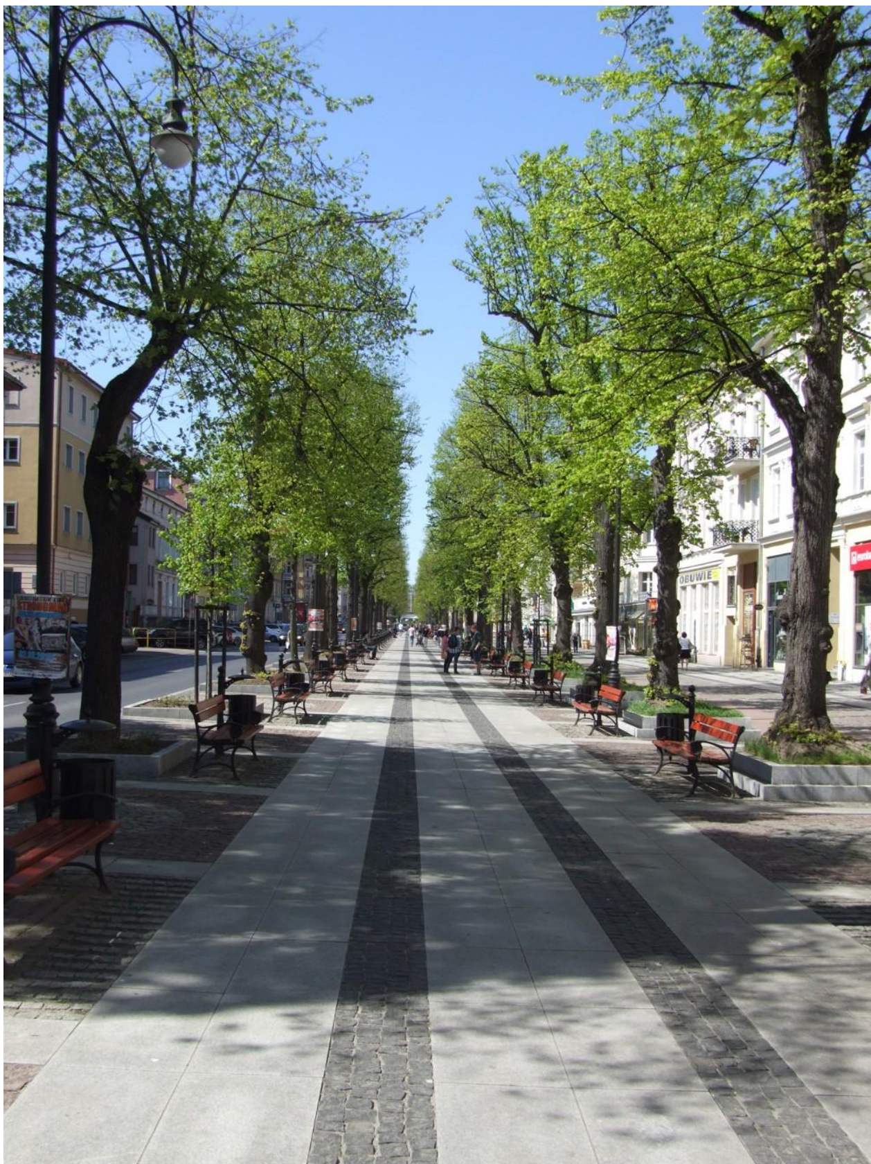
Fot. Ulica Wojska Polskiego, stan po przebudowie, 2014 r.