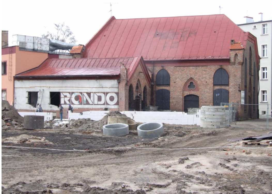
Fot. Teatr RONDO, w trakcie przebudowy, 2012 r.