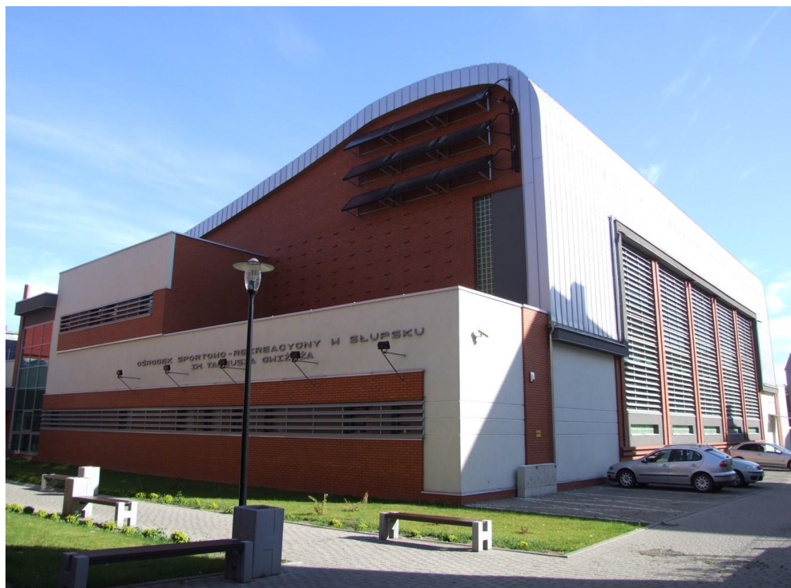
Fot. Centrum Sportowo-Rekreacyjne przy ulicy Niedziałkowskiego, 2014 r.