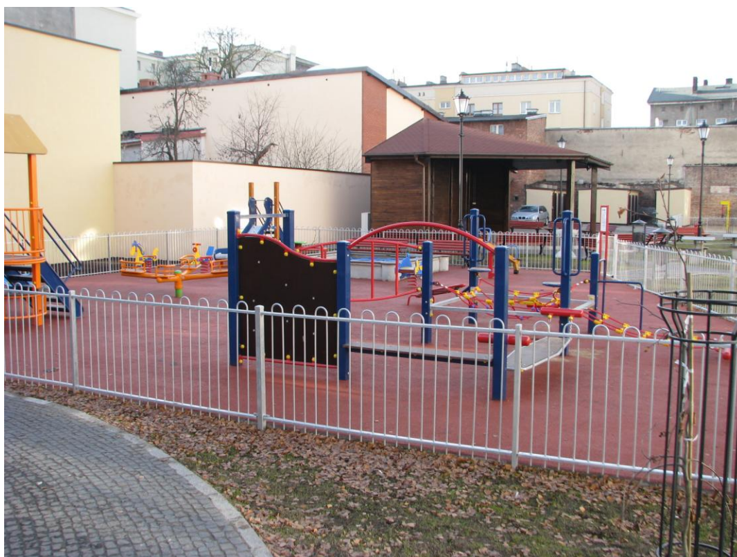
Fot. Teren tzw. Podwórka Kulturalnego, stan po przebudowie, 2011 r.